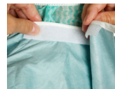
5. Fäst kardborrefixeringen i nacken.