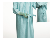
9. Fatta skärpets långa ände, och dra försiktigt loss den från bältbrickan. Knyt ihop båda ändarna.

Läs mer på www.molnlycke.se Molnlycke Health Care AB, Box 1586, Carlshovsgränd 1, 201 22 Örebro, Sweden. Tel: 021 - 722 20 00 Varuslagens, leverans och transportvillkor och EMBROIDERED är godkända registerade av ett eller flera företag. Molnlycke Health Care Group. © 2020 Molnlycke Health Care AB. All rights reserved.