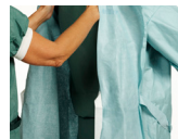
4. Den cirkulerande sköterskan ska dra ner rocken över axlarna genom att endast röra rockens insida.