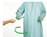
8. Lämna över bälteskorset till den cirkulerande sköterskan, denna person får endast vidröra den vita delen på brickan. Vrid 3/4 varv åt vänster så att skärpets långa ände möter upp den korta.