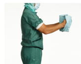
1. För in båda händerna i ärmhålen. Håll ut rocken från kroppen och låt den veckla upp sig helt.

Fatta tag i den sterila rocken och gå till ett område där du kan öppna rocken utan risk för kontaminering.