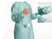
2000-talet Om öppen teknik ska användas vid handskpåtagning, låt muddkanten stanna vid knogarna. 2000-talet Vid slutet teknik, låt händerna stanna kvar i ärmen och dra in mudden från insidan (lilla bilden).