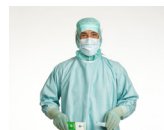
7. Efter handskpåtagning, lossa skärpets vänstra korta ände från bältbrickan.