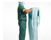
2. För in armarna i rockens ärmar, håll händerna i axelhöjd och bort från kroppen.