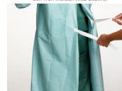
6. Knyt rockens inre band.