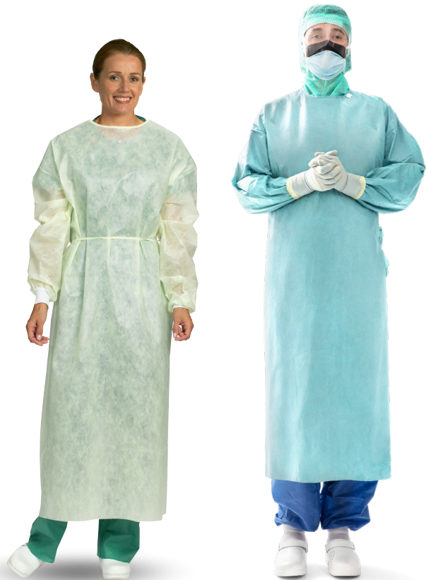
Osteril långärmad skyddsrock

I denna kommunikation diskuteras och presenteras rekommendationerna för av- och påtagning av långärmade osterila skyddsrockar för engångsbruk, osterila undersökningshandskar, sterila operationshandskar samt vikten av handhygien.